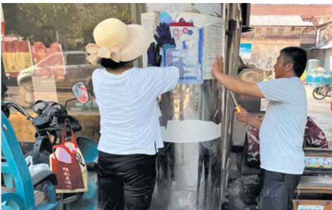
济阳区域管局在全区范围内开展户外非法小广告专项整治行动，扮靓城市“新容颜”。

为进一步营造规范有序、整洁优美的市容环境，有效遏制户外小广告乱贴乱画，连日来，济阳区域管局以落实“门前五包”责任制为着力点，聚焦城市乱贴乱画问题，找准问题、精准发力、综合施策，在全区范围内开展户外非法小广告专项整治行动，扮靓城市“新容颜”。