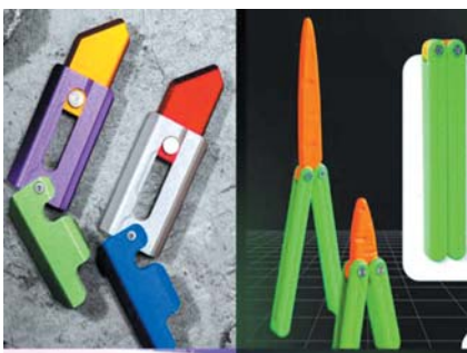
各种款式的萝卜刀

记者注意到，商家在宣传各种款式的萝卜刀短视频中，往往会伴有“捅”“刺”的动作。一位商家在与记者沟通时表示：“不建议14周岁以下的未成年人购买。”