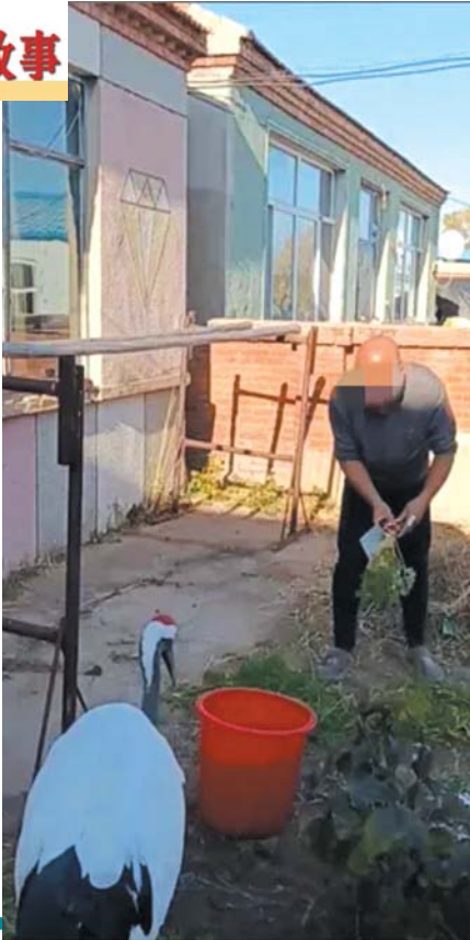
曾受过他们照顾的丹顶鹤每天准时来村民家“打卡”。视频截图

10月11日，“受伤丹顶鹤被女子照顾每天准时到访”的话题登上了热搜。视频的发布者在接受媒体采访时表示，这只丹顶鹤此前腿部受伤，被妻子精心照顾，此后丹顶鹤每天都会来自家小院，像上班一样准时，白天飞来晚上飞走。 对此黑龙江省扎龙国家级自然保护区管理局的工作人员介绍，散养的丹顶鹤有近人性，会对食物产生依赖，不过随着活动区间扩大和觅食能力增强，它们会逐渐实现野化和放归。