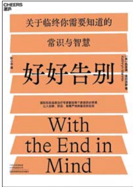
《好好告别》 [英]凯瑟琳·曼尼克斯 著 彭小华 译 湛庐文化 河南科学技术出版社