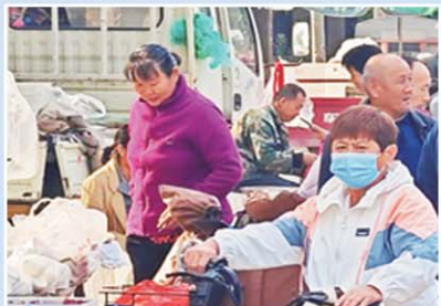
孝兴家园便民广场里人来人往