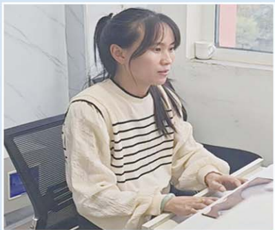
段女士在物业上班,实现家门口就业

2017年,山东启动黄河滩区脱贫迁建民生工程,60万滩区群众搬离黄河滩。同年,济南市长清区孝里街道也启动了滩区迁建工作。2020年起,39个村庄的3.2万孝兴街道滩区人陆续入住新家——孝兴家园,这里也成为山东黄河滩区最大的外迁安置区。三年过去了,滩区人民生活发生了翻天覆地的改变。