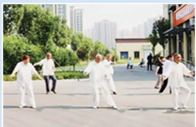
孝兴家园居民正在练太极