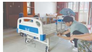
居家养老服务(闵善优护)之家庭养老床位建设。