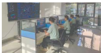
历城区养老服务信息平台。