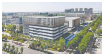
闵善康养中心(历城区养老服务中心)。