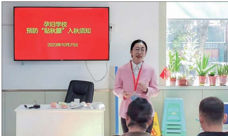
为辖区孕产妇开展健康科普知识宣教。

任城区妇幼保健院通过此类下基层服务活动，让广大群众进一步巩固“每个人都是自己健康的第一责任人”的健康理念，提高群众学习健康知识的主动性。下一步工作中，任城区妇幼保健院将持续发挥三级妇幼保健院资源优势，将医护人员下沉，保持健康巡诊和孕产妇保健课堂等下基层服务工作常态化，不断完善上下联动、优势互补、资源共享的运行机制，持续维护母婴健康，提高辖区群众健康水平。