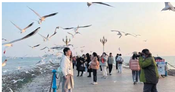
▲如今栈桥上拍照摊位已经“消失”。