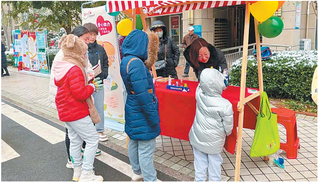
开展“立德树人 德润童心”心理咨询公益活动。

为深化家庭教育和未成年人思想道德工作，围绕全环境立德树人根本任务，立足家庭主阵地，章丘区妇联充分发挥“联”的优势，广泛开展形式多样的“德润童心”家庭教育主题活动，积极营造关爱保护未成年人健康成长的良好环境，共谱立德树人“家”篇章。