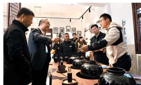
总编们在桂林村调研采风。