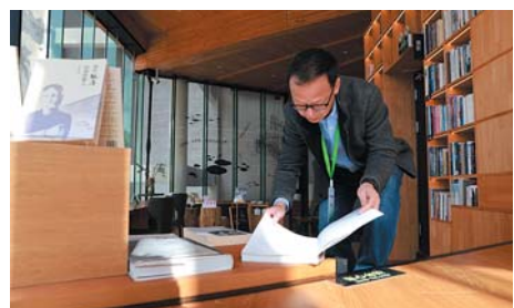
调研团成员在方所文化村网红书塔翻阅书籍。