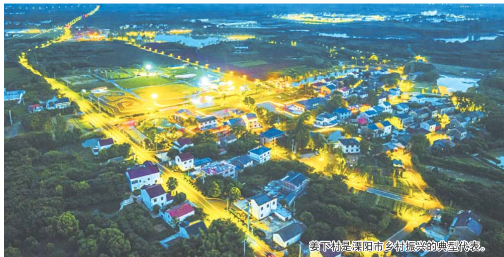
姜下村是溧阳市乡村振兴的典型代表。

天目湖方所文化村以传统江南水乡体系为基础,村内以景观水系、6座现代廊桥串联起9个徽派建筑组团,保留山墙、屋顶、青瓦,墙体修缮与作旧,辅以现代木构空间,构成整体方村聚落,创建现代江南水乡体系,打造新一代的文旅标杆。网红书塔、艺术展厅、