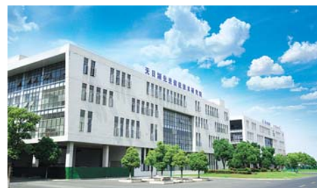
天目湖先进储能技术研究院致力于新能源研发。