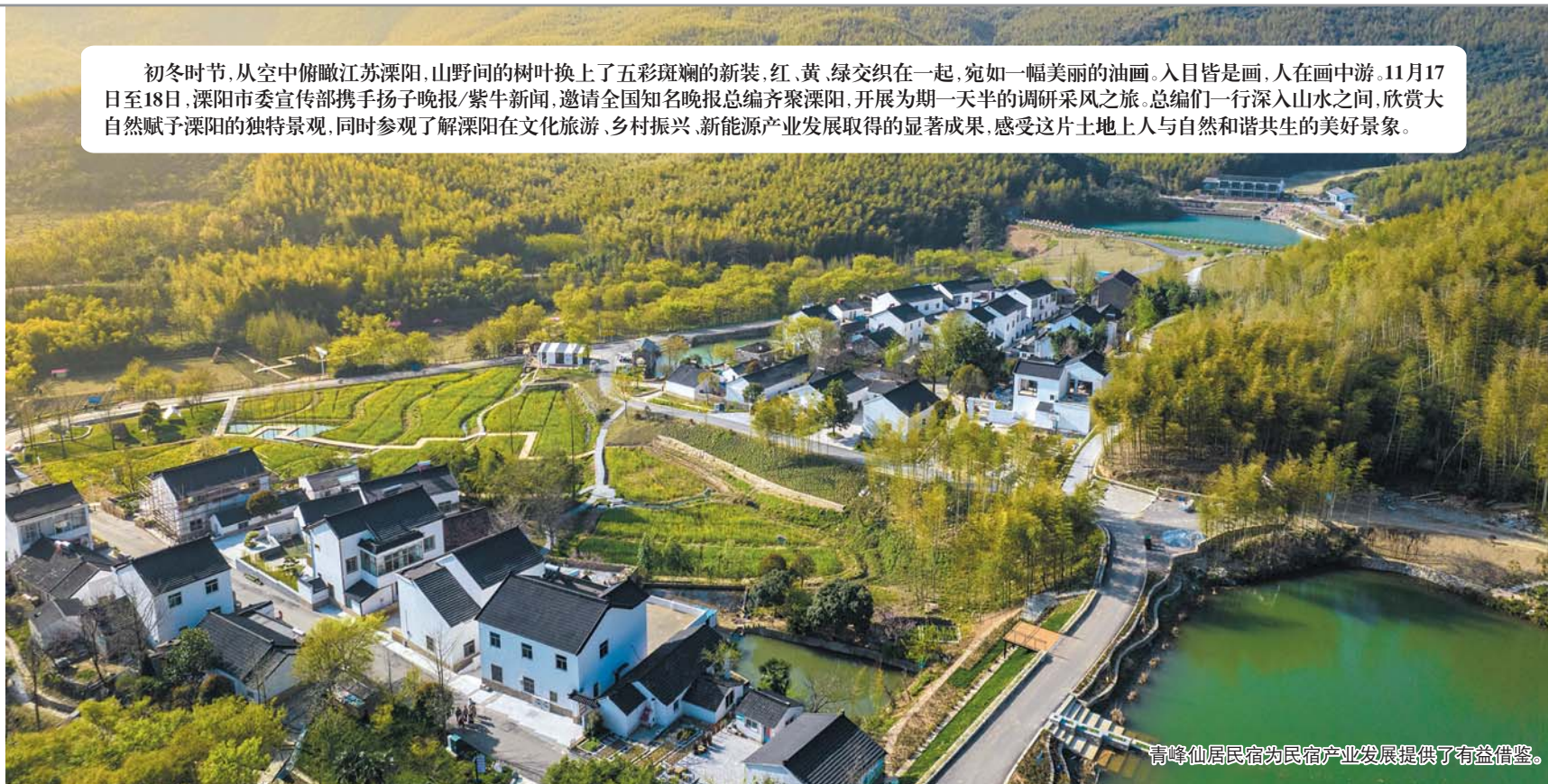
青峰仙居民宿为民宿产业发展提供了有益借鉴。

初冬时节,从空中俯瞰江苏溧阳,山野间的树叶换上了五彩斑斓的新装,红、黄、绿交织在一起,宛如一幅美丽的油画。入目皆是画,人在画中游。11月17日至18日,溧阳市委宣传部携手扬子晚报/紫牛新闻,邀请全国知名晚报总编齐聚溧阳,开展为期一天半的调研采风之旅。总编们一行深入山水之间,欣赏大自然赋予溧阳的独特景观,同时参观了解溧阳在文化旅游、乡村振兴、新能源产业发展取得的显著成果,感受这片土地上人与自然和谐共生的美好景象。