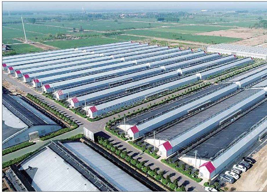
商河乡村振兴进入片区联动新阶段。