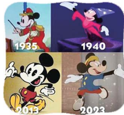
不同年代的米老鼠形象