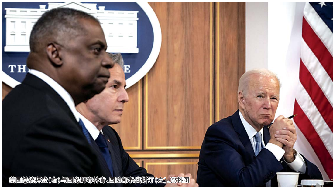
美国总统拜登(右)与国务卿布林肯、国防部长奥斯汀(左)。资料图

美国五角大楼当地时间7日披露国防部长奥斯汀“脱岗”事件更多信息，包括奥斯汀曾入住重症监护室，通知副防长“顶班”却未告知原因。此事曝光后在政界引发批评。白宫国家安全委员会战略沟通协调员柯比8日说，总统拜登没有将奥斯汀解职的计划。