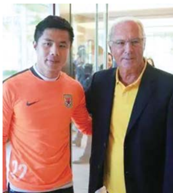
2016年，造访鲁能的贝肯鲍尔同蒿俊闵亲切合影。山东泰山足球俱乐部

2000年，贝肯鲍尔来中国参加首届中国国际足球博览会，还在时任中国足协副主席阎世铎和专职副主席张吉龙的陪伴下，去北京建国门附近的烤鸭店就餐，据报道，在诱人的烤鸭被端上饭桌时，贝肯鲍尔情不自禁地站起来，亲自操刀“片鸭”。拿到餐刀后，“足球皇帝”还忘不了幽默一把。他手持餐刀突然对周围的人做出一副“磨刀霍霍向牛羊”的架势，搞得大家哄堂大笑。