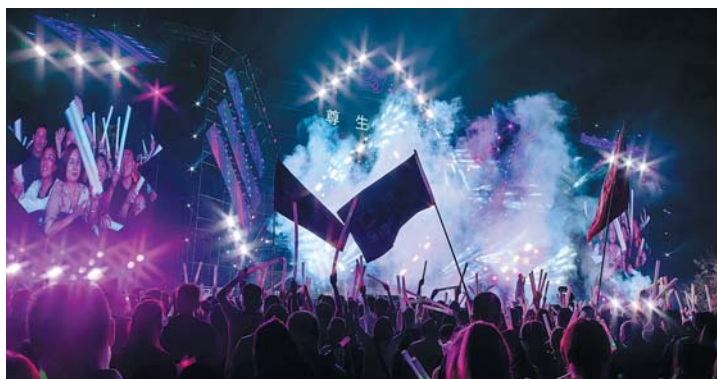
九如山音乐节点燃南山热情。

动文旅融合持续发力,投资1.2亿元的四季村宾馆改善配套提升改造项目完成建设,并投入试运营。同时,新增过联审民宿11家,78间客房,“泉城人家”三星级以上精品民宿客房262间,全市占比25.6%,南部山区持续推动民宿集聚发展,民宿规模