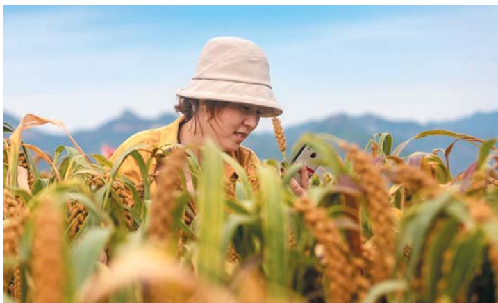
南山小米是米中上品,被称为“金小米”。