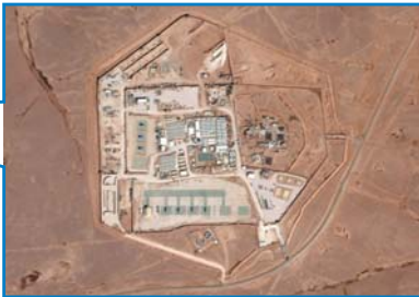
▲遇袭美军基地卫星资料图。