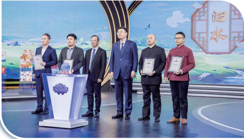
“好品山东 商行天下”泗水专场推介活动在济南成功举办。

投资拉动坚实有力。实施“招商引资突破年”活动,建立集中推介、集中研判、集中签约、集中开工、集中解困、集中观摩招商工作机制,新签约落地过亿元项目21个。打好专班全流程服务、“晨会制”等服务保障“组合拳”,集中开工总投资146.6亿元的项目35个,入选省级重点产业项目8个、市级10个,无穷、联桥服饰等10个项目竣工投产,园区发展步伐加快,投资4.1亿元实施基础设施项目7个,新建标准化厂房9万平方米,新入驻企业32家,工业产值达到113亿元,增长8%,入选省绿色低碳高质量发展园区试点名单。