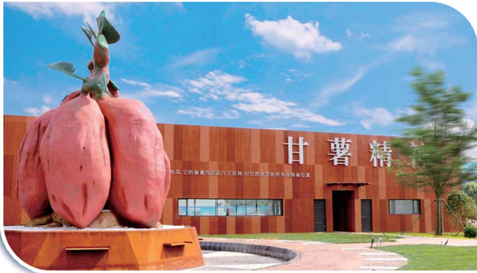
“泗水地瓜”品牌愈发闪亮。

品7个。新增国家级新型农业经营示范主体1家、市级16家,创建省级农业产业化强镇2个。乡村环境更显秀丽。开展人居环境综合整治“揭榜挂帅”活动,新建省级美丽乡村3个、市级20个。圣水峪镇东仲都入选全国美丽休闲乡村,金庄镇下家庄入选全国乡村治理示范村。改造农村危房185户,农厕204户,改建农村公路70公里。实施省级重点水利工程16项,入选全国现代化水库运行管理矩阵建设先行先试区。