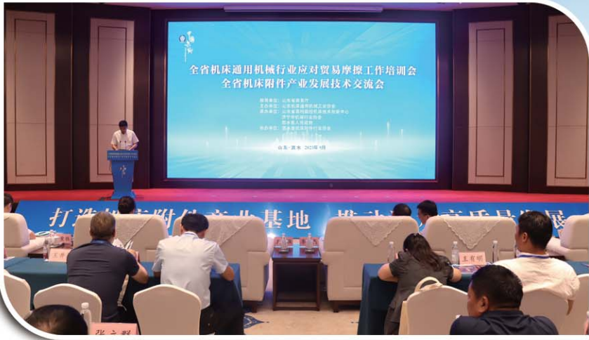
泗水创成山东省机床附件产业基地。

主导产业持续壮大。四大主导产业产值达到118亿元。实施技改项目103个,技改投资43亿元,增长10%。助企攀登企业增至56家,14家营收增幅超50%。新增国家级专精特新小巨人2家,省级12家,新增省级瞪羚企业5家、“泰山品质”认证企业1家。食品加工业入选省中小企业特色产业集群,创成山东省机床附件产业基地。