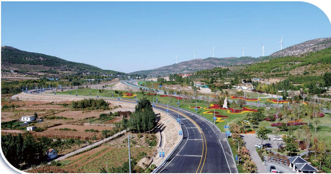
512省道改造提升工程建成通车。

城市更新步伐加快。泗水县被确定为全省第一批城市公园绿地开放共享试点县、信用交通县。新建改造中册南路等6条城市道路。512省道改造提升工程建成通车。实施4.3公里道路管网、73个小区雨污分流改造;新增城市绿地254亩。新建商品房55.1万平方米;改造提升老旧小区29个,惠及居民2225户。开展“擦亮小城镇”建设美丽城镇行动,完成8个