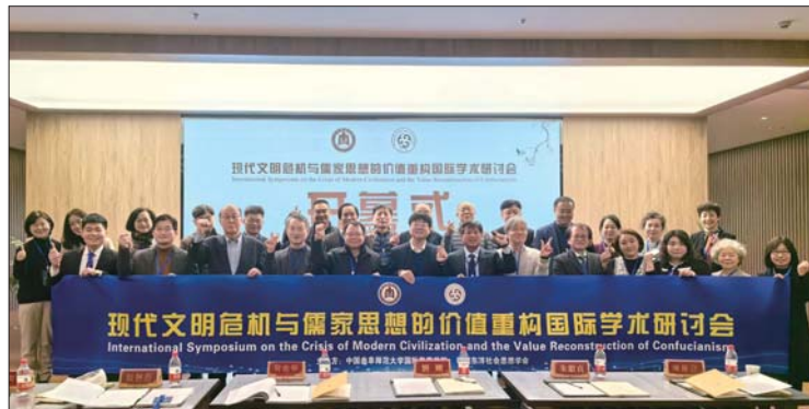
与会专家学者合影留念。

会议结束后,外方代表团实地参访了曲阜、邹城等地的孔孟历史文化遗迹,感受了“东方圣城”源远流长的传统文脉和博大厚重的历史底蕴。