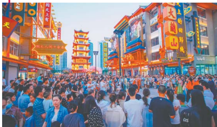
“灯火阑珊·新琅琊”国潮市集。

从最早的以物易物交易场所，到如今的文创、非遗、古风、美食等类型的打卡目的地，文旅赋能下的市集被赋予新的文化内涵，兼具时尚感、文化味、烟火气，焕发出新的时代色彩。