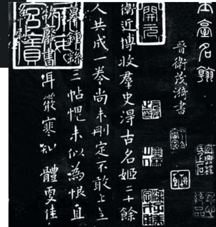
▲蔡文姬《我生帖》 ►卫夫人《名姬帖》