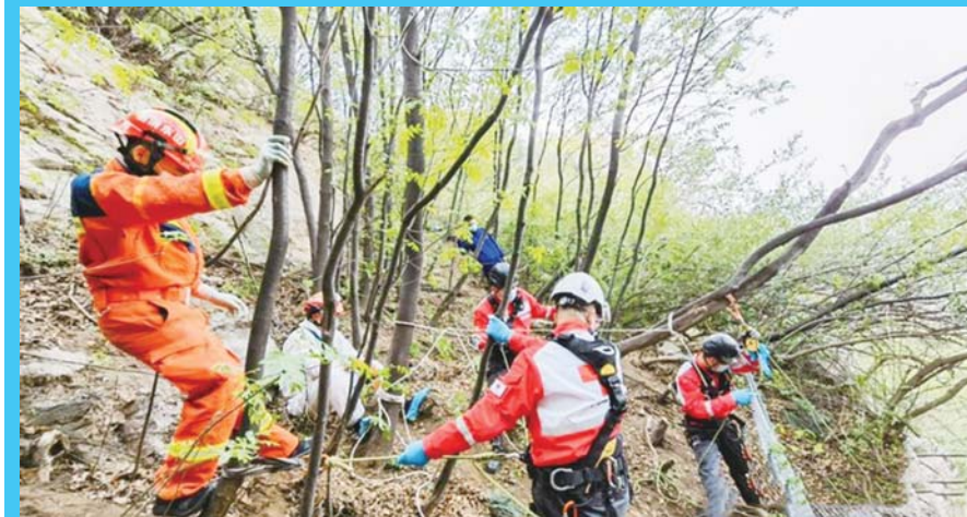
救援人员在悬崖下搜救。