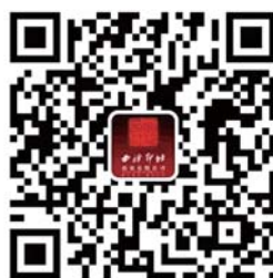
西泠拍卖官方微信

2024年艺术巨匠,西泠印社首任社长吴昌硕诞辰180周年之际,西泠拍卖“纪念吴昌硕诞辰180周年·特别征集”持续进行中,面向社会各界广泛征集吴昌硕先生书画、篆刻等门类藏品。