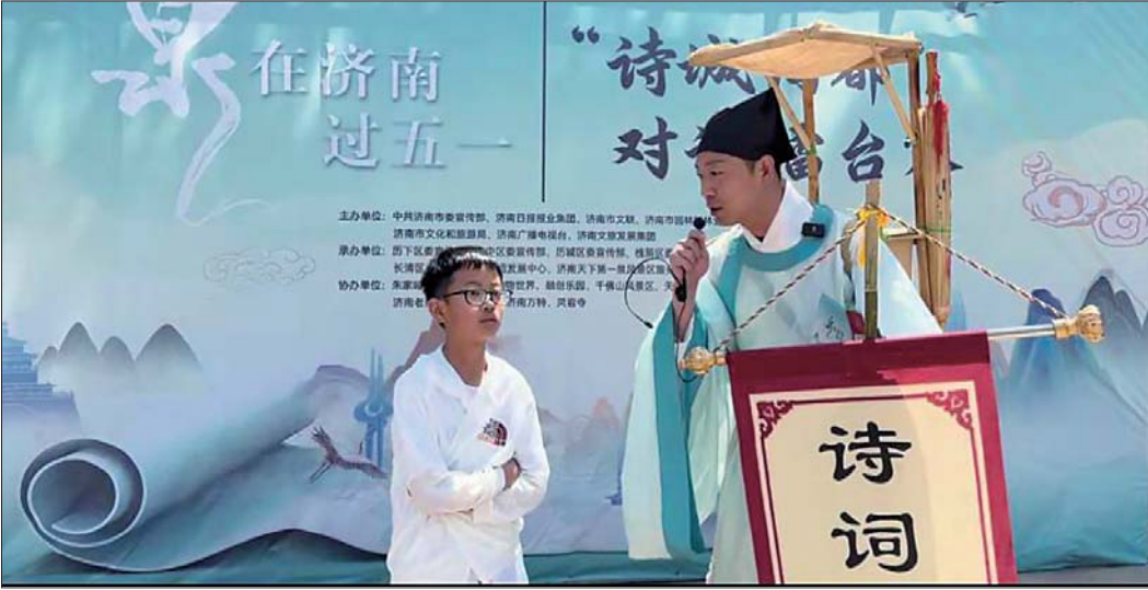
在灵岩寺“诗城词都”擂台赛上,一名小朋友正在“打擂”。

这个“五一”假期,山东全省文旅市场火热,供给端产品业态丰富,为游客献上了一场异彩纷呈的文旅盛宴。除了传统的看美景、品美食、露营、演艺深度体验游、研学游、乡村游也吸引了大批游客打卡。除此之外,这个假期,山东还涌现出哪些新玩法?