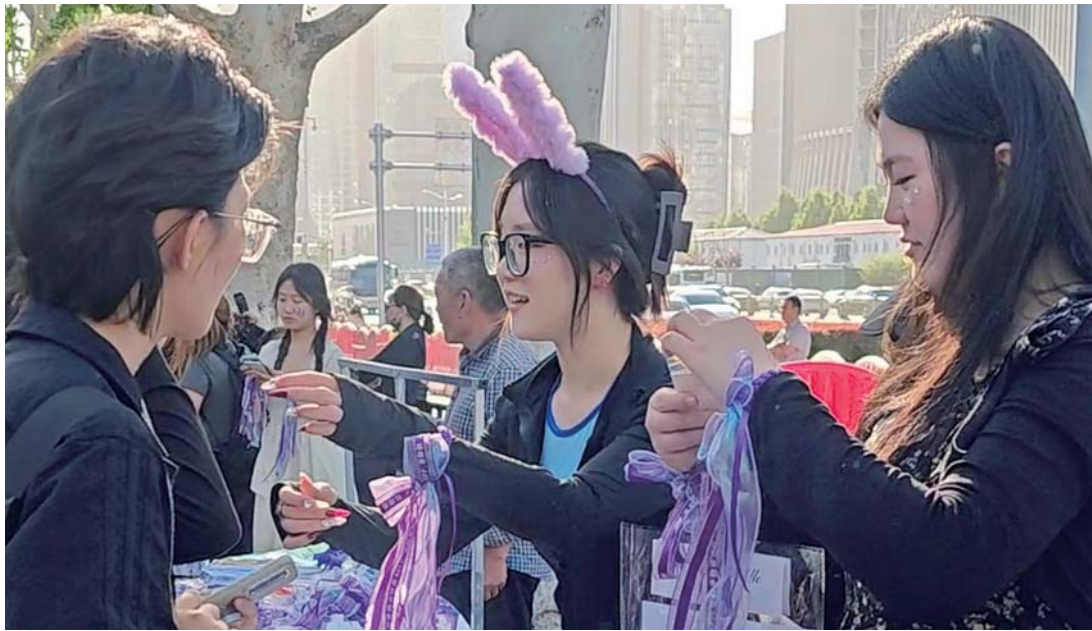
11日,林俊杰济南站演唱会开始前,场外各类小摊绵延数百米。

演唱会开始后,小摊的人气也不减。很多没买到入场票的游客三三两两坐在路边,聚在一起