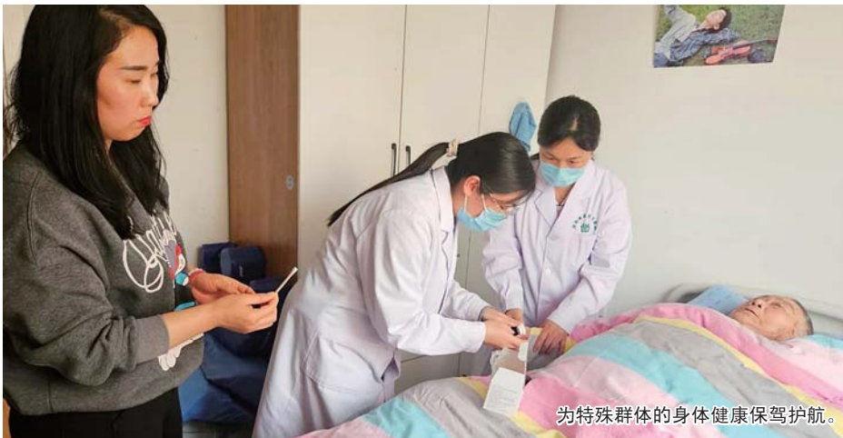
为特殊群体的身体健康保驾护航。