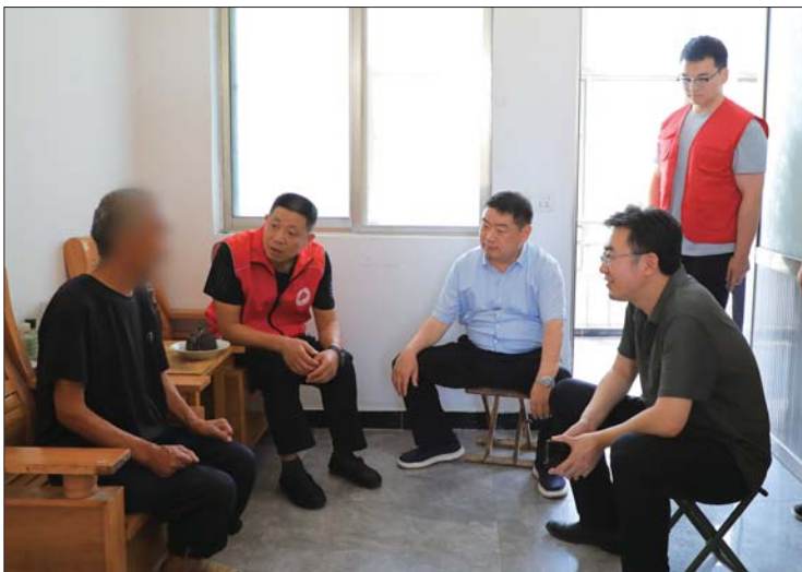
多方联手，共商救助方案。

对于大多数流浪者来说，流浪的结束不仅意味着一个身份的落地，更是和家乡的团聚。为做好流浪乞讨人员源头治理工作，济宁市救助管理站多措并举加强流浪返乡人员安置，对无实际赡养人的老年流浪人员进行敬老院集中供养，使其生活有保障，真正实现了老有所养，流浪人员有人照管。