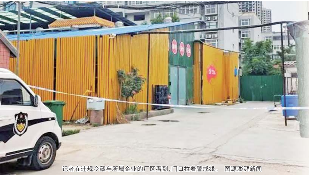
记者在违规冷藏车所属企业的厂区看到，门口拉着警戒线。