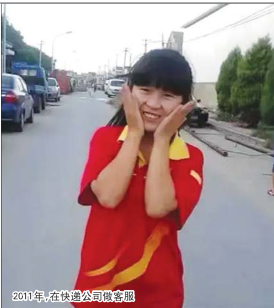
2011年,在快递公司做客服

在排除了一些需要大量计算的专业后,我选择了北京大学的心理学专业,这个专业没有数学,在备考过程中我才发现这门学科也需要做数据分析,要学习统计学,但已经不能回头了,只能硬着头皮