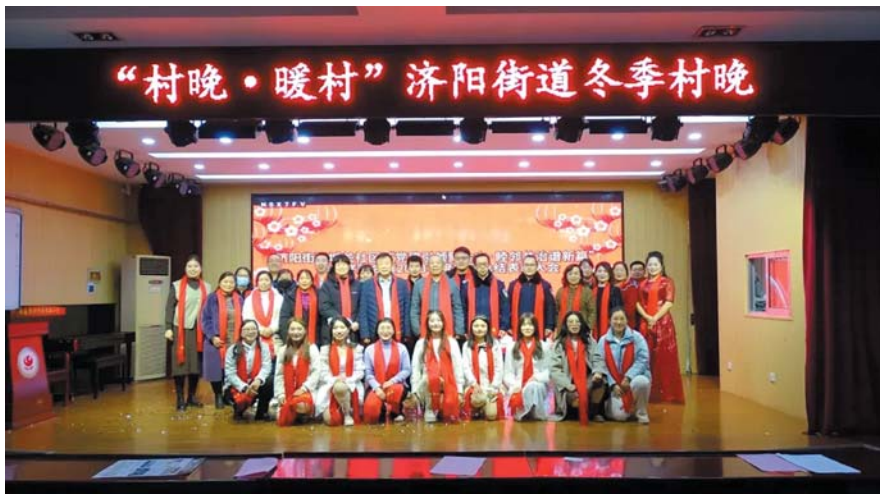
常态化开展文化活动,组织春季、夏季、秋季、冬季村晚等12余次。

事儿X情感扶贫)等获区级以上奖励4次;本站创作及辅导的作品在区级以上刊物发表或展览100余件(次)。2023年开展各级各类演出场次达86场次,深受群众喜爱。