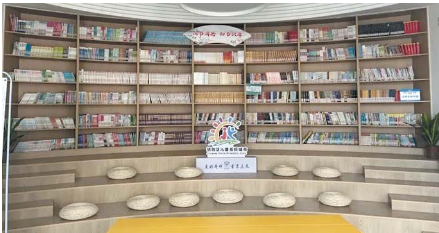
济阳街道综合文化站配备多功能活动厅、泉城书房等10余个活动室。

济阳街道综合文化站着力培植街道文化先进典型,积极开展“庄户剧团”“群众文化带头人”等基层文化评选活动,规范街道群众文化阵地建设,选拔出12支具有积极带动作用的文艺表演队伍和100余名文艺人才,创作群众性小戏小剧6部,树立了康寿戏剧社、济阳区吕剧文艺演出队等示范典型,积极引导其开展文化惠民宣传演出,以点带面,推动街道基层文化建设繁荣发展,有效地改善和保障文化民生。综合文化站年均组织创作并演出的作品、节目6件以上,积极培养辅导的广大文艺爱好者开展创作,《说说小区那些