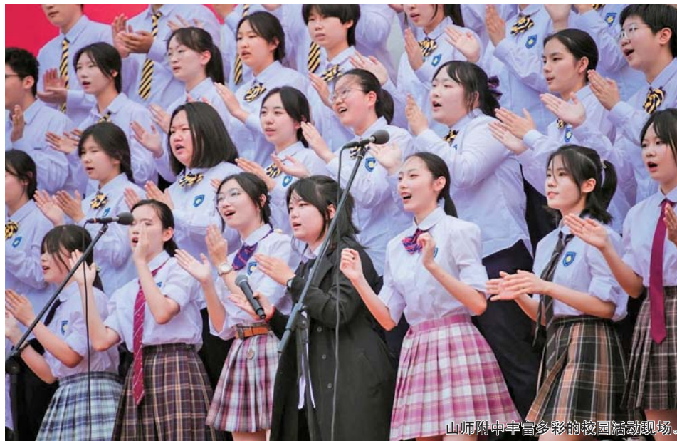
山师附中丰富多彩的校园活动现场。

划和高考的多元课程体系,将教学工作整合成一个协调一致的系统。借助山东大学基础教育集团的丰富资源,学校实施了一体化的培养模式,旨在为有潜力的学生提供适宜的成长环境,让他们的才华在各自擅长的领域得到充分展现。