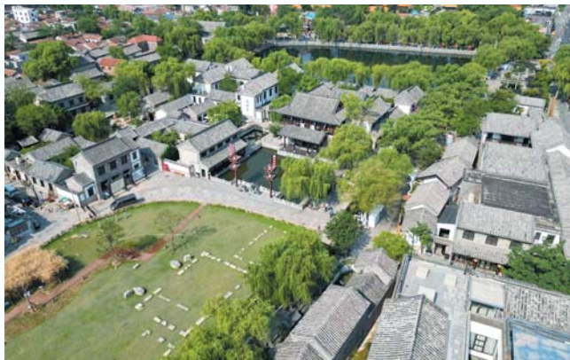
着力打造精品化的街区形象，带动古城大片区产业发展。

着力打造精品化的街区形象、便利化的消费场景、智慧化的管理应用，使泉城金街涅槃重生，努力在济南创建国际消费中心城市过程中当好标杆、走在前列。