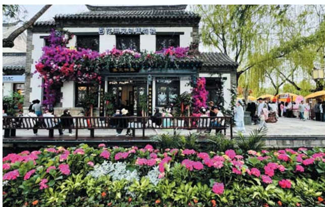
市民游客在百花洲休闲游玩，体验古城风韵。