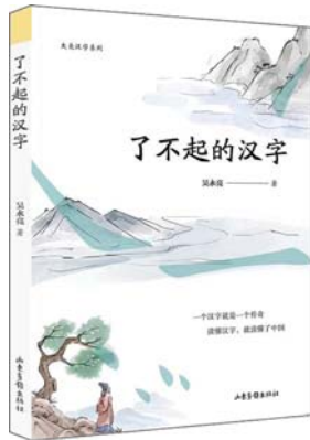
《了不起的汉字》 吴永亮 著 山东画报出版社