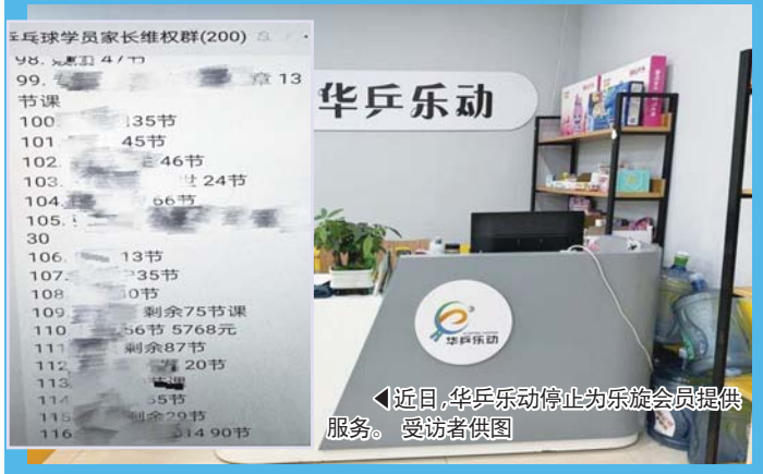
近日，华乒乐动停止为乐旋会员提供服务。

近期，多位济南市民向齐鲁晚报·齐鲁壹点记者反映：华乒乐动多家门店发布消息称不再为乐旋学员提供教学服务，剩余课时不能继续使用，也不能退费，消费者陷入维权难题中。据了解，乐旋为全国连锁门店，在上海、西安、济南、青岛等地有超300家门店，2024年初，其在全国范围内出现突然闭店情况。