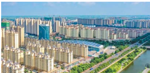
面向征迁群众的各个安置房项目,都安排在了县城的“黄金地段”。