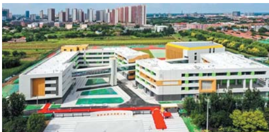
在商河,修得最好的建筑是学校,最美的环境是校园。

按照“学前普惠、小学集中、初中进城、高中提升”的工作思路,商河县以全学段融通提质培优为抓手,实施“育名师、创名校、铸名牌”三名工程,办学质量不断提升,2020年—2023年,引进1018名