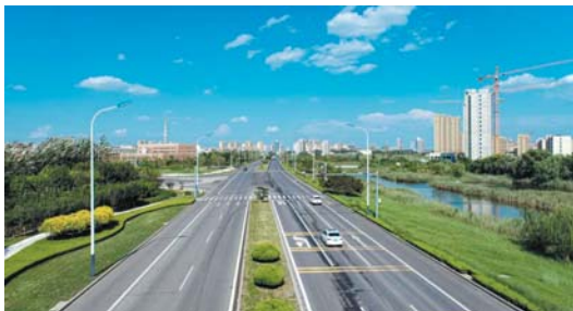
商河县正向着“高铁时代”“航空时代”加速迈进。