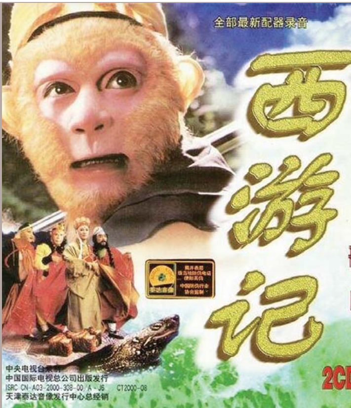
全部最新配器录音

近日，随着国内首款3A游戏《黑神话：悟空》的爆火，《西游记》中的经典配乐《云宫迅音》重焕光彩。许多观众或许并不知道这首曲子的正式名称，但说起86版《西游记》的开篇曲“diu diu diu”或者“灯灯等灯”，可以说是无人不知无人不晓。而经典剧集的经典旋律，随时会迎来翻红的机会。