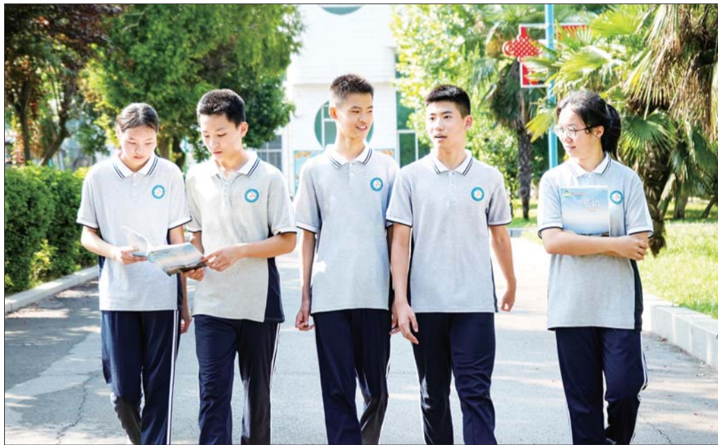
意气风发的七中学子。

学校结合重大节日、纪念日，常态化组织开展德育主题活动，持续强化“活动育人”成效。同时，结合济宁地域特色，持续开展优秀传统文化“两创”工作，不断加深学生爱国情怀，提升民族自豪感，激发他们为