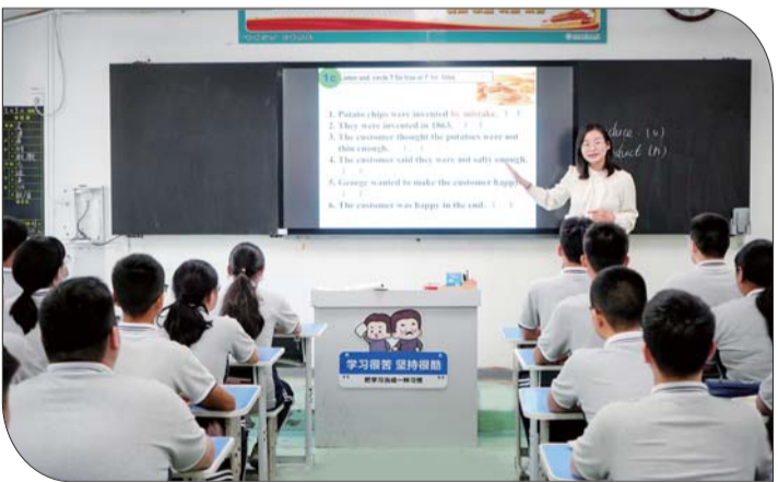
课堂上，教师在精心上课。