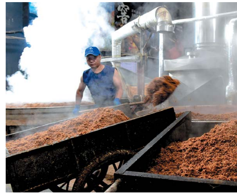
九龙醉酿酒车间。