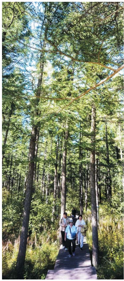
漫步塞罕坝林场。