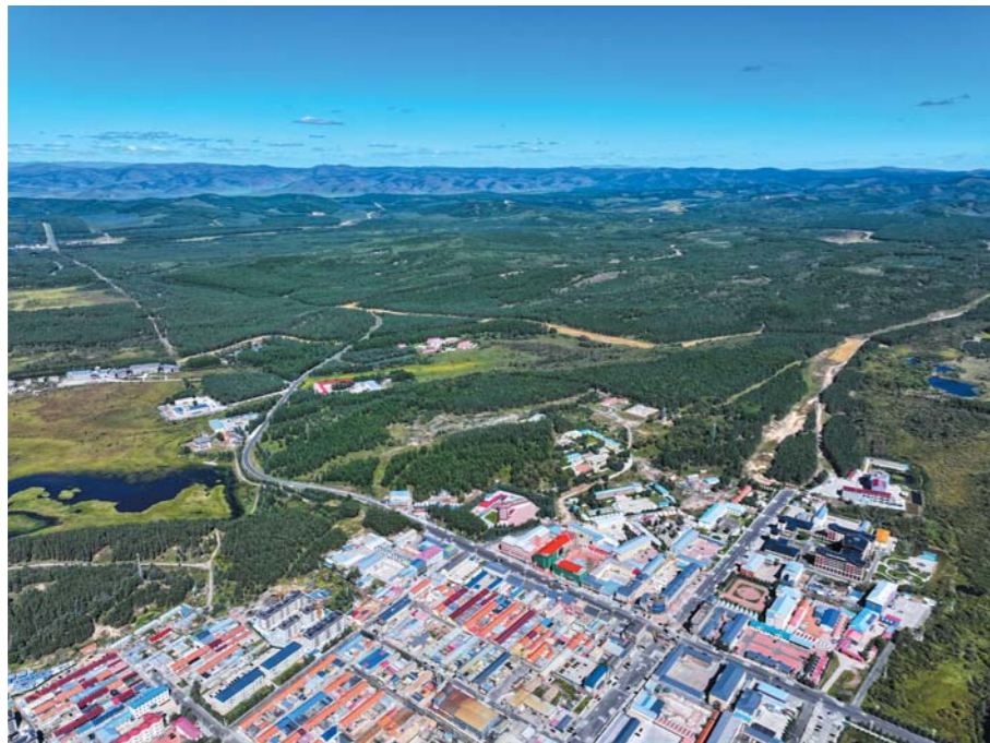
塞罕坝林场小镇。