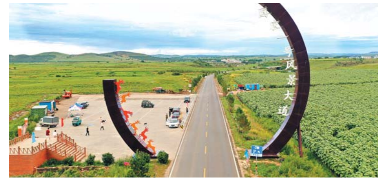
国家一号风景大道。