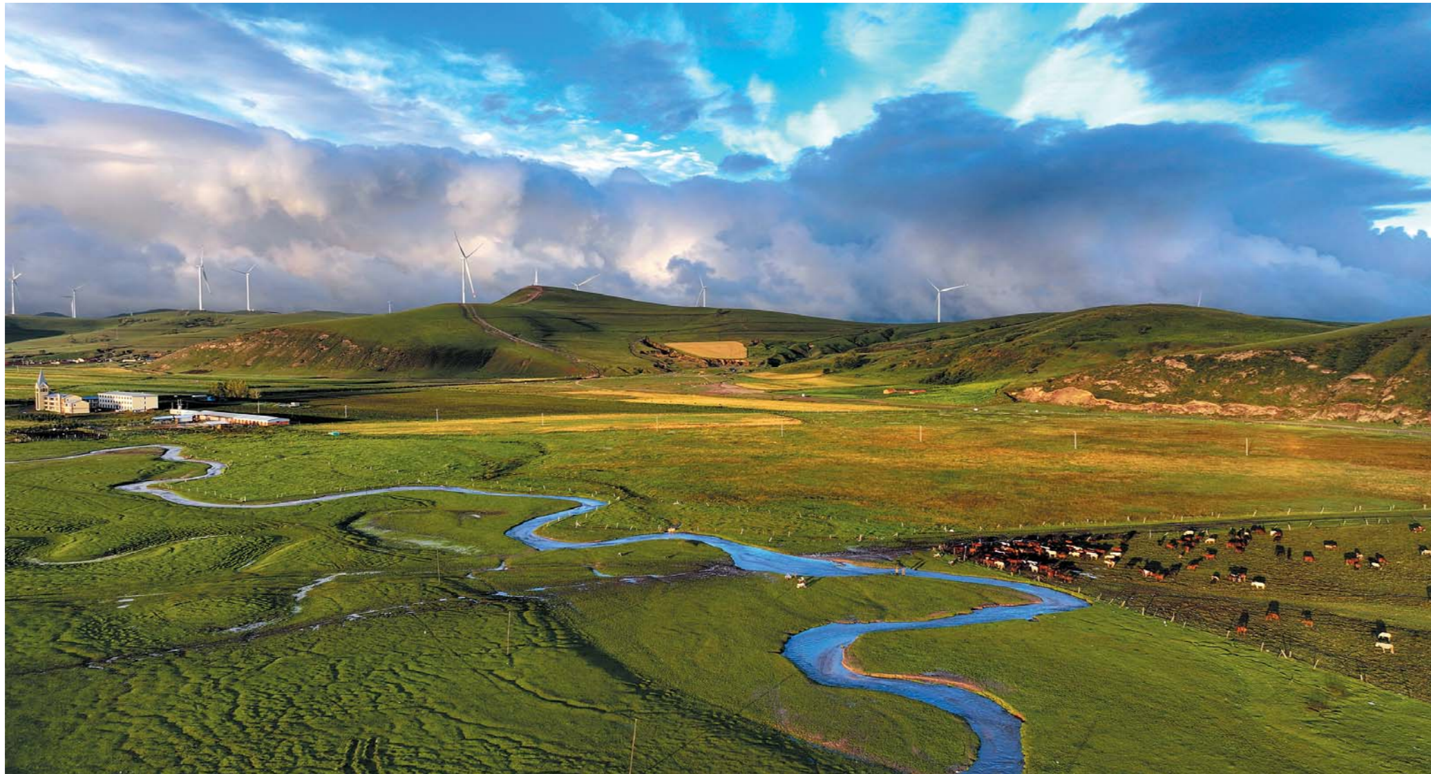
丰宁坝上草原风光。