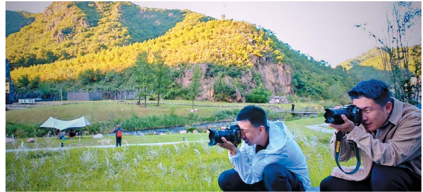
美景留住摄影大咖的镜头。