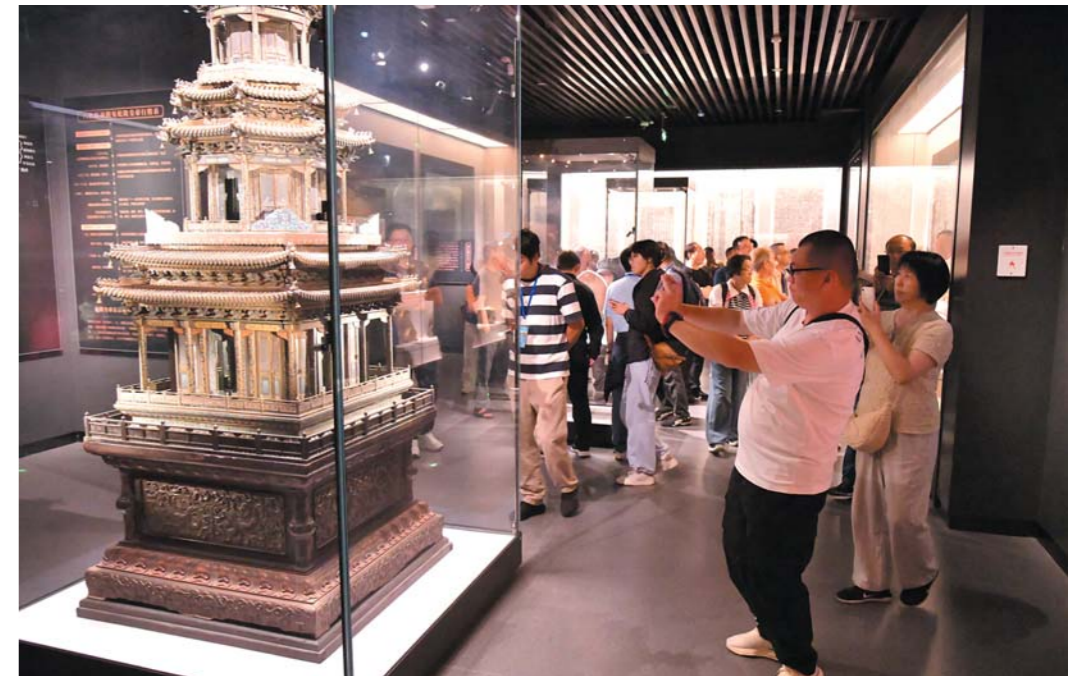
参观承德博物馆。