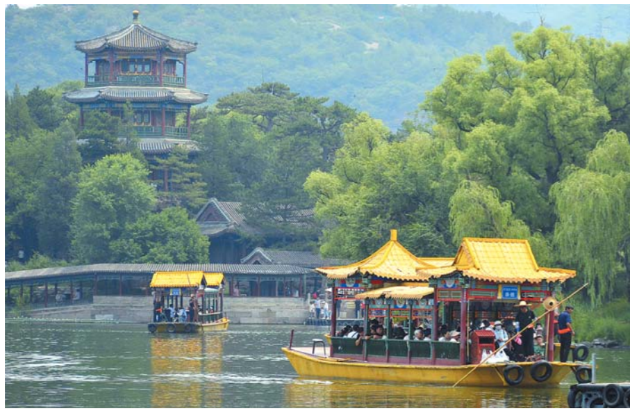
承德避暑山庄。

9月初,“康养避暑地·热河温泉城”全国主流媒体“看承德 拍生态”大型采访活动举行,来自全国近30家主流媒体的记者相约武烈河畔,感受紫塞大地独特自然人文魅力,见证在不断建设中蓬勃发展的“承德风采”。