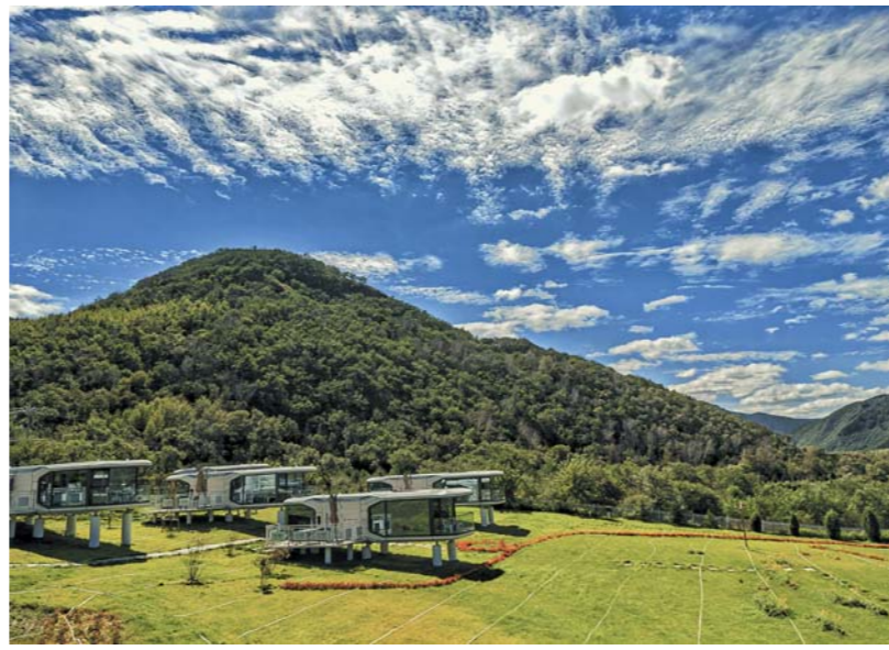
一号风景大道宿营地。

此外,承德市还培育打造了鼎盛王朝文化产业园、金山岭长城国家公园、丰宁马镇旅游度假区等一批文旅融合新业态。下一步,承德将始终秉持“绿水青山就是金山银山”的理念,持续提升经济实力,发展动力、创新活力和核心竞争力,闯出一条“生态优先、绿色发展”的蝶变之路。