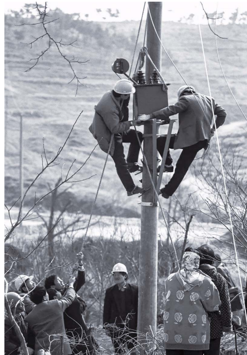
1996年2月18日, 除夕当天, 临沂费县只有8户人家的西红峪通了电, 标志着我省在全国率先实现全省户户通电。

电力事关国计民生, 对经济社会发展和社会稳定具有重要作用, 沿着时光的隧道向前追溯, 山东电力史上的一个个“第一”、“一幕幕”率先, 就像标尺一样, 见证着历史的沧桑, 度量着山东经济发展向上、向好, 再向高质量发展的步伐, 成为一代代山东电力人热血沸腾的共同记忆。