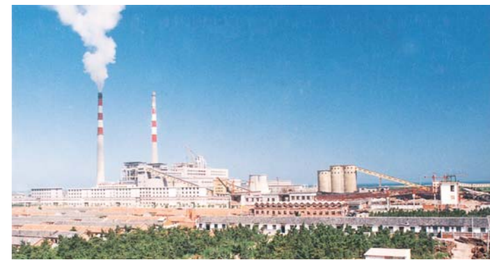
1981年山东电力开工建设全国首家集资办电企业——龙口电厂。