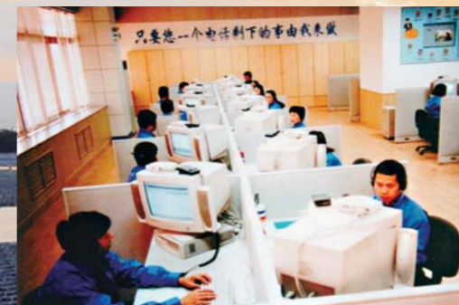
1989年, 山东电力在全国电力系统率先开通24小时免费服务热线。

2021年12月30日, 世界单体最大水上漂浮式光伏电站——华能德州丁庄水库320兆瓦项目合容量并网发电。