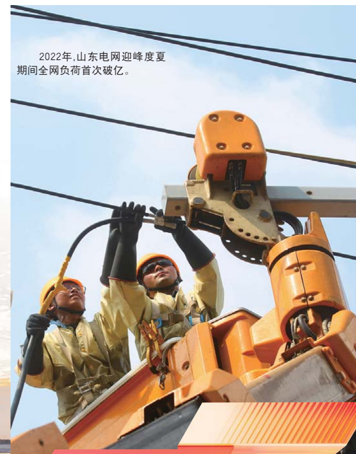
2022年, 山东电网迎峰度夏期间全网负荷首次破亿。