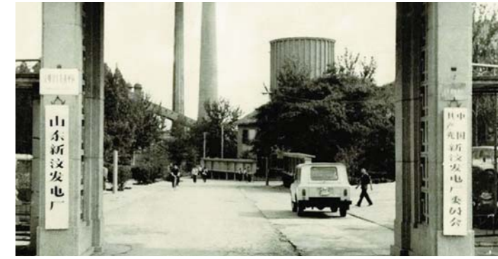
1956年7月, 新中国成立后山东第一个新建电厂新汶发电厂建成投运。