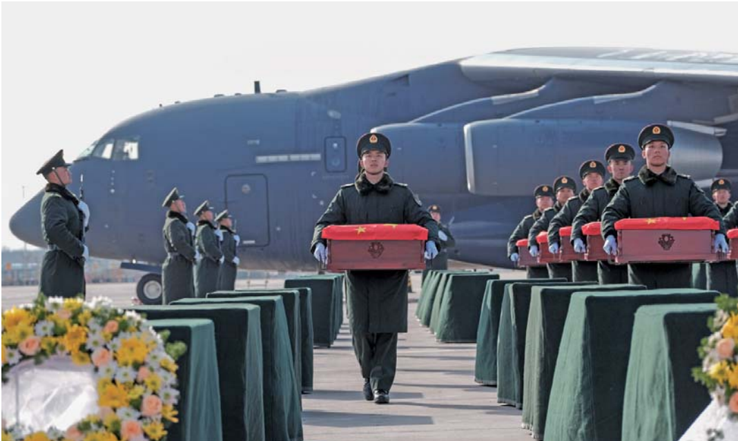
28日，在沈阳桃仙国际机场，礼兵将殓放志愿军烈士遗骸的棺槨从专机上护送至棺槨摆放区。 新华社发

新华社沈阳11月28日电 第十一批在韩中国人民志愿军烈士遗骸迎回仪式28日在沈阳举行。43位志愿军烈士遗骸及495件遗物由我空军专机从韩国接回至辽宁沈阳，回到祖国怀抱。