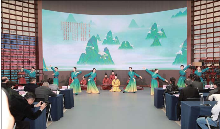
颁奖典礼现场举行精彩的孔子文化主题表演。

参赛者们以孔子文化为载体,充分发挥奇思妙想,将孔子所代表的儒家思想、经典名言、历史故事等元素巧妙融入各类创意作品之中,让古老的孔子文