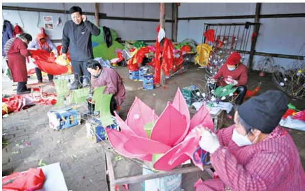
花灯制作全是传统手工艺,为附近村民带来收入。