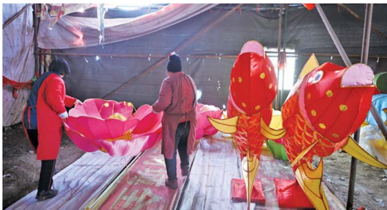
做好的花灯放在仓库里,等着安装。