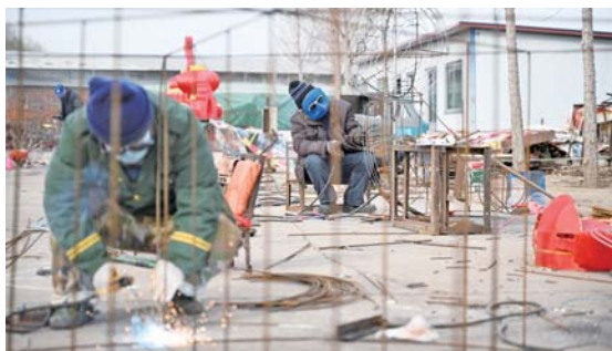
工人们正在用钢筋做造型和进行焊接。