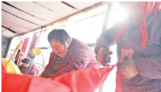
做完花灯框架之后,再进行糊裱。