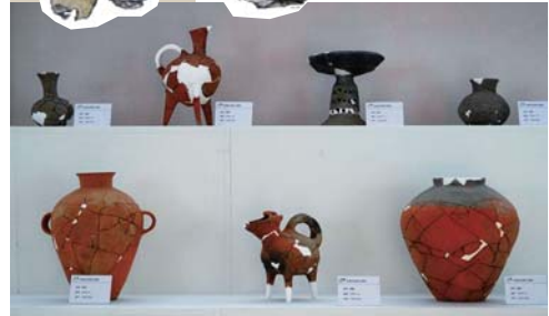
▲王庄遗址出土的陶器。