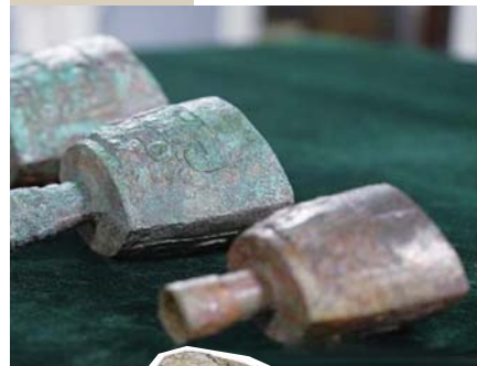
▲东安古城出土的兽面纹铜铙。 ▲三星堆遗址出土的玉石上阳刻的侧身人像。

华龙洞人是迄今东亚地区呈现出智人(现代人)特征最多、年代最早的从古老型人类向智人过渡的古人类。华龙洞人的面部和下颌部已经开始向智人演化:面部扁平、眼眶较高、头骨纤细化、出现了智人标志性特征——下巴的雏形。学界认为,下巴是人类独一无二的特征。