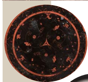
▲天津十四仓遗址考古发掘区全景。 ▲安徽淮南武王墩主墓内出土的漆盘纹饰。