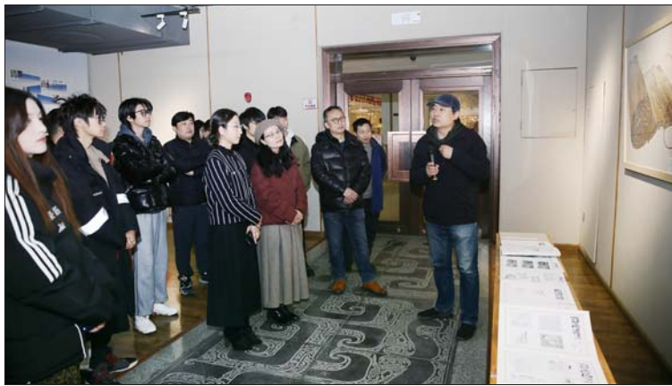
央美师生在孔子研究院观展。

设计学院联合主办，孔子研究院、曲阜师范大学美术与书法学院协办，北京非物质文化遗产保护基金会公益支持。展览以“即凡而圣——论语意象”为主题，将精微素描与