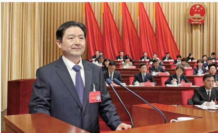
章丘区人民政府区长边祥为向大会作政府工作报告。

服务消费是民生福祉改善提升的重要支撑,也是推动经济高质量发展的重要内生动力。2025年,章丘区着力优化消费供给,全面推进消费品以旧换新,扩大新能源汽车消费,提振房地产消费,加快章丘印象城、海荟广场等项目建设,实施一刻钟便民生活圈改造,积极推动城市公园+消费、景区+消费,高质量办好“畅享泉城购、优品在章丘”2025消费节,全年开展50场以上促消费活动,形成“季季有主题、月月有热点、周周有场景”的浓厚氛围。