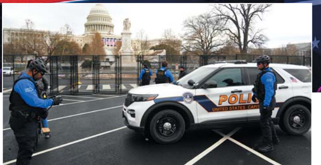
►1月18日，警察在美国首都华盛顿的国会大厦外执勤。新华社发