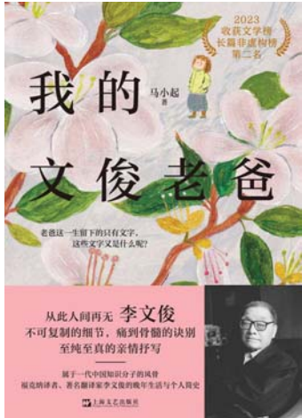
2024年7月，《我的文俊老爸》由上海文艺出版社推出单行本。

对他也很喜欢。当时钱锺书知道我要译福克纳，他对我说‘愿上帝保佑你’。”可见，就连钱锺书也视福克纳为一块难以翻译的“硬骨头”。