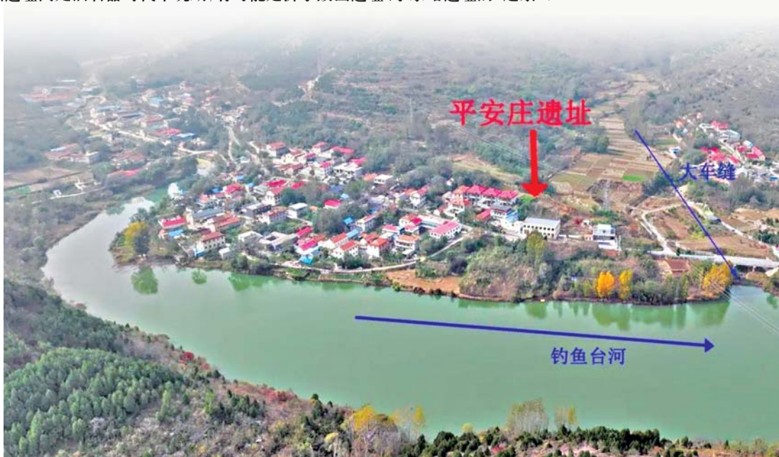
青州平安庄遗址航拍图

2024年3月22日，山东临沂沂水跋山遗址入选“2023年度全国十大考古新发现”。该发现填补了山东及中国北方地区旧石器时代考古的空白，构建了沂河上游区域距今10万至1万年的考古文化序列，保存距今10万至5万年的古人类活动珍贵证据，特别是10万年前古人类对巨型动物资源的利用实证。近日，2024年度山东省五大考古新发现初评结果揭晓，10个人入围终评的项目中，青州市平安庄遗址第一个公布，该遗址同处旧石器时代中晚期，有可能是沂水跋山遗址、水泉峪遗址的“远亲”。