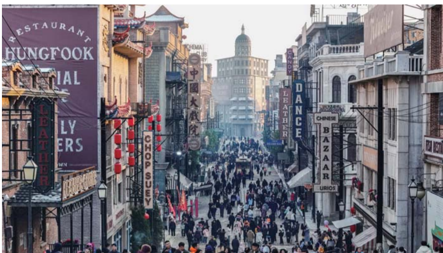
乐陵影视城开园首日迎客超两万人次。

在刚刚过去的春节假期，限时开放的乐陵影视城带动周边景区景点及商圈接待游客近70万人次，旅游综合收入超过9000万元……鲁西北小城乐陵，接住了这波大流量，文旅产业破题起势，逐梦“影视+文旅”，“诗和远方”清晰可见。