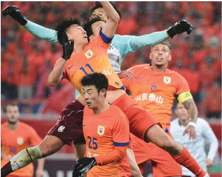
2月11日夜, 济南奥体中心, 亚冠精英联赛山东泰山3:1获胜。这是两队球员在光州队球门前的激烈争抢。

因此山东泰山此次出征, 虽然形势大好, 但更需要排除干扰, 全力争胜, 而不是把希望寄托在对手放水。