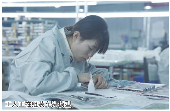
工人正在组装车头模型。

在聊城莘县王庄集镇的小微企业创业园内，一排排标准化厂房看似普通，这里生产的轨道交通模型却占据了全国60%的市场。从高铁动车到城市地铁，从展览级巨制到掌心微缩模型，这里生产的每一件作品都承载着中国轨道交通发展的缩影。