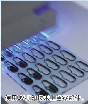
使用UV打印技术上色零部件。